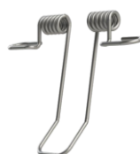
Ressorts de fixation