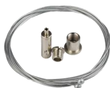
Filins de suspension